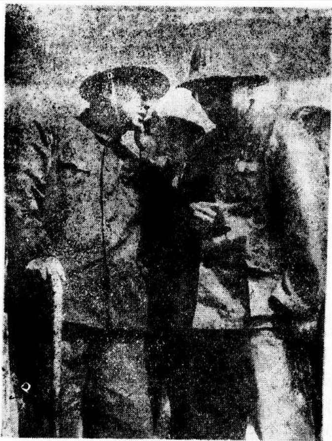
1982年华罗庚在安徽省参加两淮煤炭基地开发规划方案讨论，这是他在基地进行实地调查。

在总结多年来工业生产与管理中普及数学方法的经验与教训的基础上，华老提出了适合中国国情的优选法与统筹法，对这些方法进行了改进及简化。他又提出了计划经济的数学理论——正特征矢量方法。