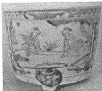
图 4 福建德化窑