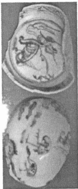
图 5 福建华安窑

在嘉靖至万历早期, 景德镇青花瓷的高档产品采用钴料为回青和石子青结合。后因回青断绝, 万历中期直至崇祯末年均采用国产浙料, 此期钴料提炼发明了较之“水选法”更先进的“火煨法”, 可除去大量有害物质, 使矿物的纯度大大提高, 从而使国产料同样可以达到明快艳丽的发色, 色泽接近“翠毛蓝”且无铁锈斑之瑕疵。景德镇高档产品均采用火煨过的上等浙料, 但中低档产品用中、下料, 发色蓝中泛灰。晚明其他青花窑口均采用各地土青, 亦有使用浙料者, 但因提纯技术欠佳, 包括闽粤窑口在内, 色泽往往显得暗