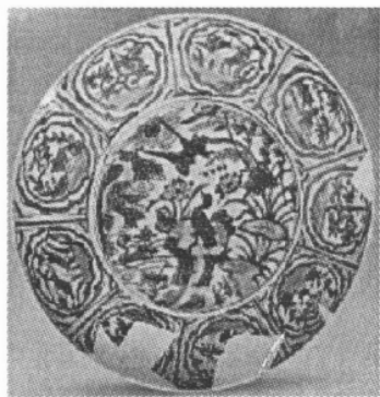
图 1 漳州平和窑青花瓷

以漳州平和窑和德化窑为代表的福建青花诸窑,产品分为明显的精粗两类。粗者胎骨疏松泛黄,釉色亦不佳。晚明德化窑青花为初创,釉色乳浊,釉厚处往往出现类同“蚯蚓走泥纹”的崩裂缩釉现象。平和窑因施釉工艺的不同,有溅釉现象。由于没有景德镇俗称为“倒角”的修足工序即将圈足外沿旋出一道细窄无釉的斜边,直接导致烧成后底足有粘砂现象,这是福建诸窑的普遍问题,也成为辨认其外销瓷克拉克瓷和“汕头器”等的最显著的外观特征。但优质的福建青