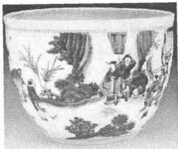
图 3 景德镇窑