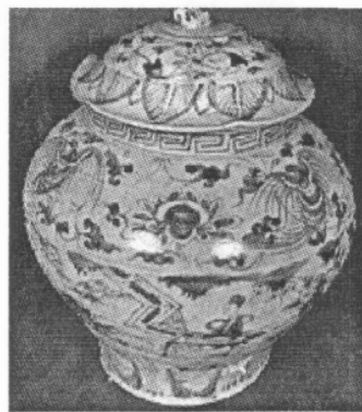
图 2 云南建水窑